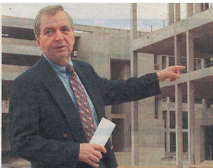
Wofür 690 000 Mark Honorar? Klaus Töpfer könnte von der Affäre um den 1993 abgesoffenen Bonner Schürmann-Bau eingeholt werden