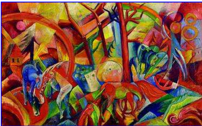
Bunt aber falsch. Rotes Bild mit Pferden. 1914 Öl auf Leinwand 62 x 100,3 cm

Endlich, im November 2006, konnte Lempertz einen „Weltrekordpreis“ vermelden: 2,9 Millionen Euro (samt Aufpreis) für Heinrich Campendonks „Rotes Bild mit Pferden“ von 1914. Das mehr als acht Jahrzehnte verschollene Gemälde verdoppelte mühelos die obere Taxe und landete den langersehten Rekord. Käufer war eine in Malta ansässige Handelsgesellschaft Trasteco Limited . Lange Jahre hatten deutsche Auktionshäuser das Nachsehen. Im Ausland, vornehmlich in London und New York wurden die kapitalen Werke eingeliefert und erzielten dort Rekordpreis um Rekordpreis. Die Schallmauer in Deutschland lag unter einer Million Euro - bis zum Sensationserfolg im renommierten Auktionshaus am Kölner Neumarkt.