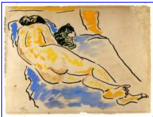
Das Original. „Liegender weiblicher Akt mit Katze“, Max-Pechstein Zeichnung (Brücke-Museum, Berlin)

Der Kölner Weltrekord-Campendonk trug gleich drei gefälschte Aufkleber: Auf dem Chassis den vermeintlichen Aufkleber der Sammlung Alfred Flechtheim, einen zweiten Aufkleber der Galerie Der Sturm, Berlin, sowie einen des Kunstsalons Emil Richter, Dresden. Dreifach etikettiert hält besser, werden sich die Fälscher gedacht haben. Die Kenner, die mitverdienen