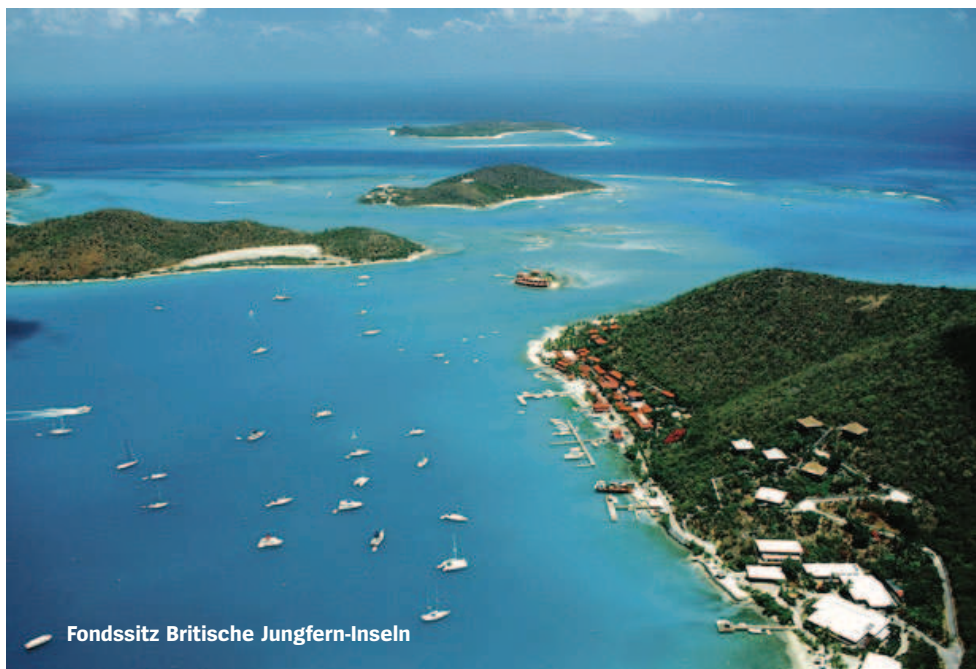
Fondssitz Britische Jungfern-Inseln