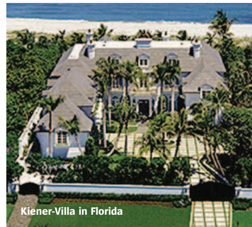
Kiener-Villa in Florida